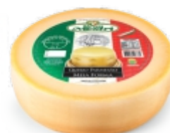
QUEIJO PARMESÃO GRAN MESTRI 7Kg