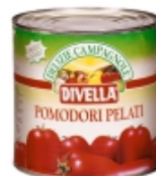
POMODORI ITALIANO DIVELLA PELATI 2,5 KGS