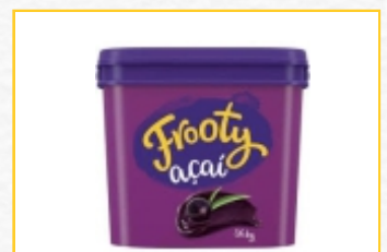
ACAÍ FROOTY 3,6 KGS ORIGINAL, BANANA E MORANGO