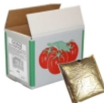
PASSATA ITALIANA BAG LA PASTINA 5 KGS