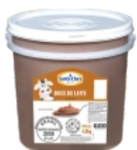
DOCE DE LEITE SANTA CLARA 1Kg e 4,8Kg