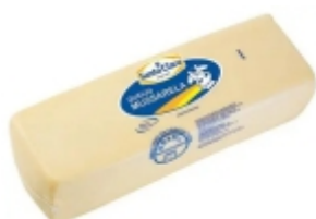
Mussarela Santa Clara 3,3 kg