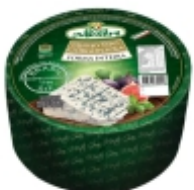
QUEIJO GORGONZOLA GRAN MESTRI 3,3 KGS