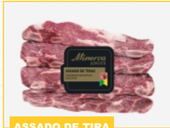
ASSADO DE TIRA