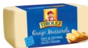
MUSSARELA TIROLEZ 3,6 KGS