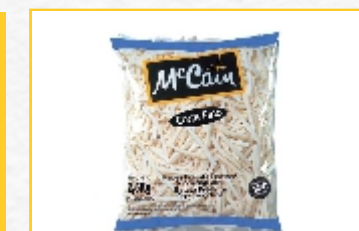
BATATA MCCAINN: Pacotes com 2,25Kg e 7mm