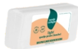
QUEIJO PRATO LIGHT VERDE CAMPO