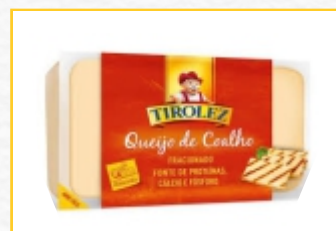
QUEIJO COALHO ABRE FÁCIL 220g