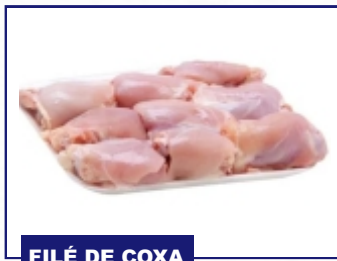
FILÉ DE COXA