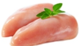
FILÉ DE PEITO