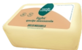
QUEIJO MUSSARELA LIGHT VERDE CAMPO