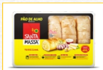
PÃO DE ALHO SANTA MASSA 400g