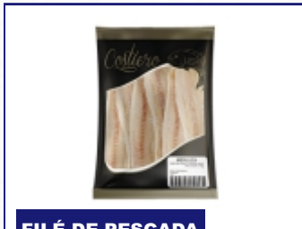
FILÉ DE PESCADA